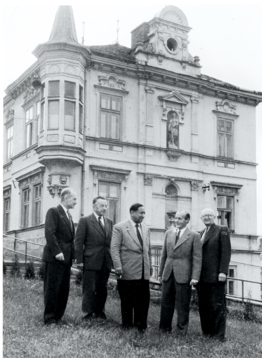
Soudruzi činovníci Československého Červeného kříže před Kubellovým domem. OŠ1 zcela vpravo. 2. pol. 50. let 20. století.