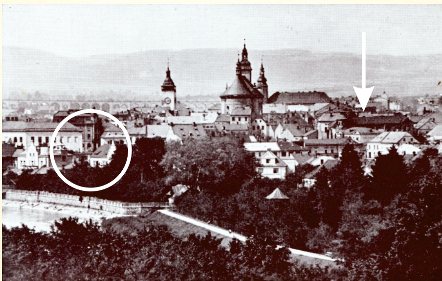
Hranice v době protektorátu (dobová pohlednice).

Srdečně Vás všechny zdraví Šámalovi z Hranic.