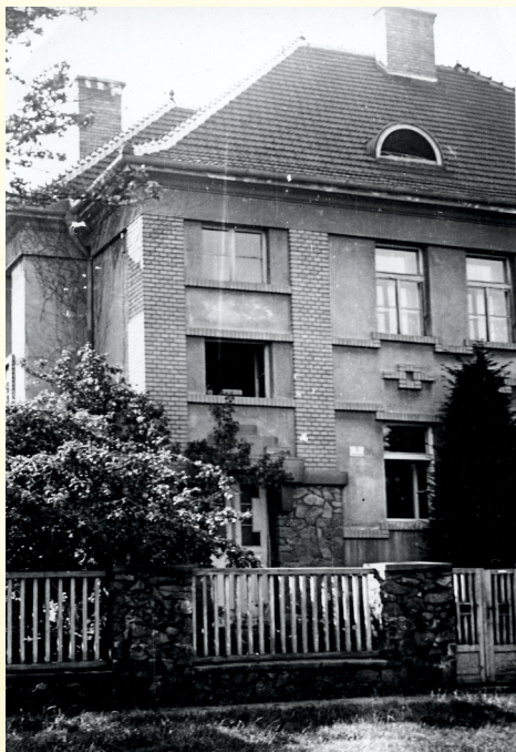
Charvatská č. 5 v Brně - Králově Poli, počátek 50. let 20. století

Němci se připravovali, ale všude byla určitá bezhlavost a ta nám