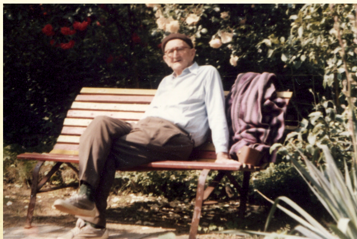
OŠ1 v červenci 1984 na zahradě v Brně, Charvatská 5, ve svých 85 letech s nezbytnou rádioukou na hlavě, kterou neodkládal ani v parném létě.