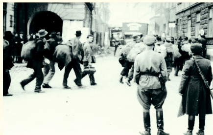
Hranice, pohled ze Školního náměstí do Radniční ulice (květen 1945, dobová fotografie)