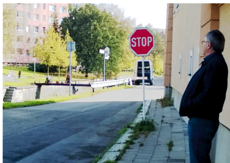
Mezi snímky, pořízenými na rohu Nerudovy ulice u říčky Veličky, uplynulo 80 let. Pózuji OŠ2 a OŠ3