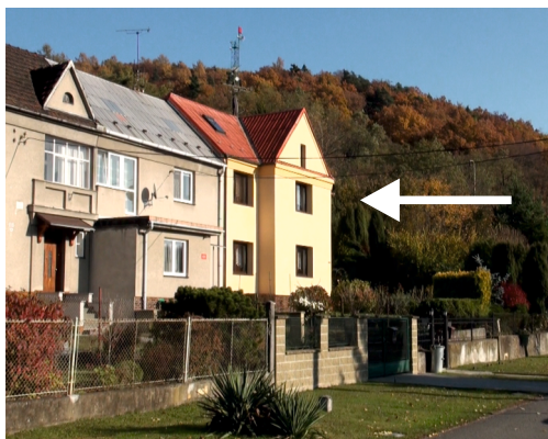
Hranice, Teplická 73, první patro, rok 2013. Vlevo kuchyně, vpravo ložnice.